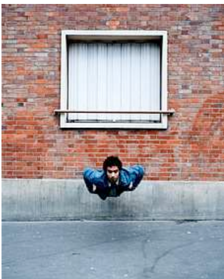
Denis Darzacq, La chute n°1, 2006

blanche d'un pied, recouverte d'un drap de douche jauni... A cet égard, le titre Que fait-il seul dans son pantalon Adidas ? est suffisamment éclairant.