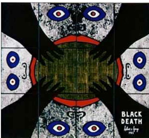
Gilbert & George, Black Death, (Mort noire) , 1983

mettent à nu la muqueuse photographique, dans son caractère lisse et brillant.