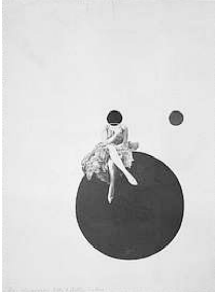
Laszlo Moholy-Nagy, Das Tanzerpaar Olly & Dolly sisters (Les Sœurs danseuses Olly et Dolly), 1925 Photomontage, épreuve gélatino-argentique, 16 x 11,7 cm Achat 1994 - AM 1994-150

Ces lettres sont aussi une référence aux origines, celles de la langue, celle du monde , comme le souligne la déchirure de ciel étoilé qui lui sort également de la bouche à la manière d'un phylactère, ou encore le schéma en coupe des gestes de l'accoucheur tout en bas de l'image. Hausmann propose ici un véritable exercice de maïeutique qui vise à nous faire accoucher du sens à partir du réel même. C'est la parole du corps, contre les constructions froides de l'esprit ; c'est la connaissance du monde par les sens et non par la mise à plat des connaissances indexées.