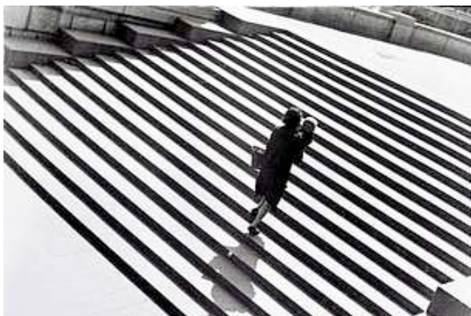
Alexandre Rodtchenko, L'Escalier , 1930