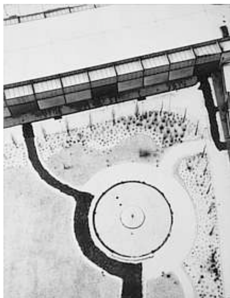
Laszlo Moholy-Nagy, From the Radio Tower. Bird's Eye View. Berlin (Vue de Berlin depuis la tour de la Radio), 1928

Laszlo Moholy-Nagy définit la photographie comme une « superposition de jeux d'esprit et de sensations visuelles » (Laszlo Moholy-Nagy, Malerei, photographie, film , Munich, Albert Langen, 1925) prônant l'étude quasi scientifique des expériences perceptives que l'artiste fait quotidiennement. La compréhension des phénomènes optiques est pour lui source de connaissance. Partant de là, les réalités les plus banales de la ville peuvent être prétextes à l'exercice d'un nouveau regard, car « la photographie révolutionne la vision » plus qu'elle ne doit chercher à reproduire le connu (Laszlo Moholy-Nagy, « How Photography Revolutionises Vision », The Listener , 8 Novembre 1933, trad. Jean Kempf). Source d'une « Nouvelle vision », d'une « Nouvelle Objectivité », ces pratiques doivent débarasser l'« Homme Nouveau » de toutes les mièvreries sentimentales et subjectivistes . En ce sens, la photographie est perçue comme un outil particulièrement adapté pour dépasser l'expression de la subjectivité individuelle et représenter le monde moderne en élevant l'art à l'échelle industrielle de son époque.