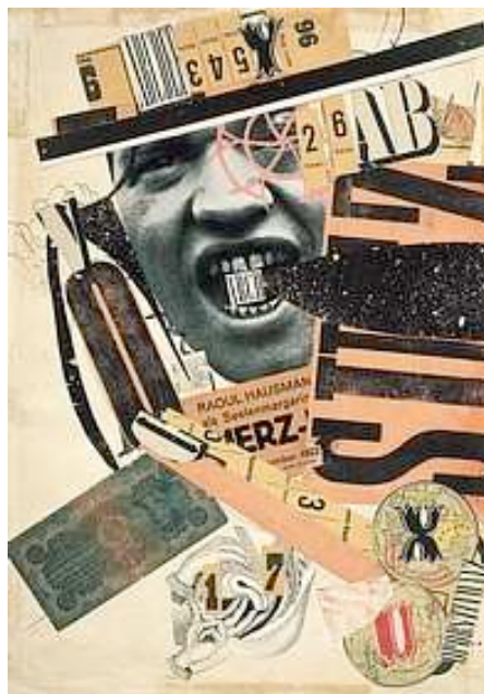
Raoul Hausmann, ABCD, 1923-1924

Les tirages superposés, ou « collages dans l'épaisseur de l'image », représentent un mode de photomontage particulièrement apprécié par les surréalistes , dans leur goût pour le rêve, la quête de l'association d'images inconscientes. Il correspond mieux au ton assagi de revendications politiques qui dériveront sensiblement de la représentation amoralisée de l'inconscient à celle de rêveries doucereuses.