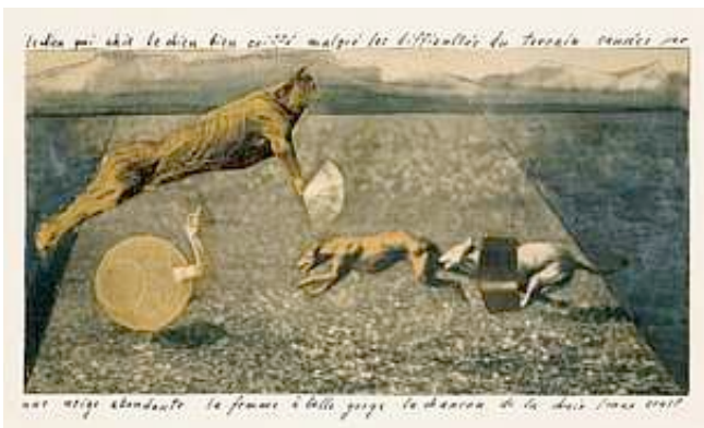
Max Ernst, La Chanson de la chair , [1920] Collage. Gouache, mine graphite et illustrations de magazine découpées et collées sur papier, 15 x 20,8 cm Achat 1981 - AM 1981-8 © Adagp, Paris 2008

Au premier coup d'œil, ce photomontage semble jouer à la fois sur la découpe nette et sur les jeux de transparence... jusqu'à ce que l'on comprenne qu'il n'y a pas de photomontage au sens propre, mais une disposition d'images découpées sur l'espace réel d'une table . La forte présence des vitres brouille les perceptions dans la simultanéité des plans. En tant qu'élément de l'esthétique urbaine, c'est un signe de la modernité. Les rapports d'échelle et de transparence, renvoyant aux préoccupations récurrentes du constructivisme, en font une image clef.